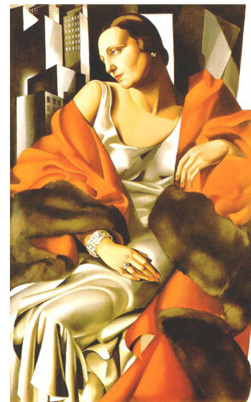
Tamara de Lempicka: "Retrato de Madame Boucard" (1931)

No século XX, progresivamente, a muller asume un rol político e social máis significativo. O cabelo curto co que Tamara de Lempicka representa ás súas mulleres urbanas, e o toque de sofisticación co que as impregna, denotan ese novo papel da muller.