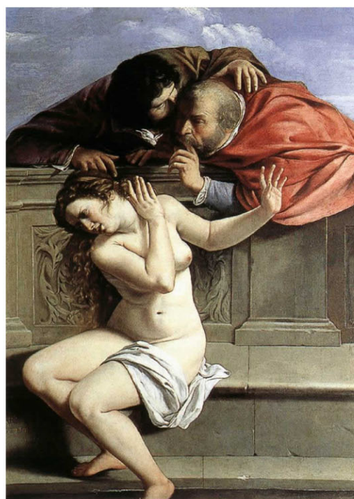
Artemisia Gentileschi: "Susana e os vellos" (1610)

Baroque, rococo, neoclassicism. Women painters had a significant role in all of the trends in European painting during the 17th and 18th centuries. Most of them came from artist families but they began to change the means in which women were depicted in art, they created images of women as conscious beings rather than detached muses, strong women determining their own destiny.